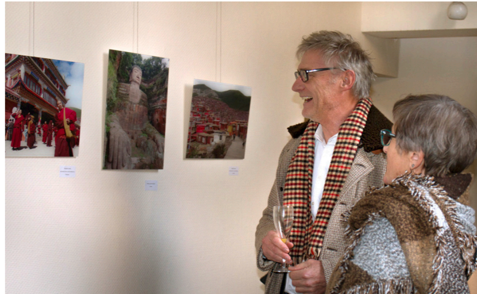
Besucher betrachten die fotografischen Eindrücke aus China.