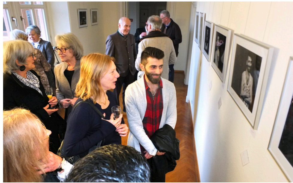
In der Ausstellung waren auch Gespräche mit den portraitierten Flüchtlingen möglich.